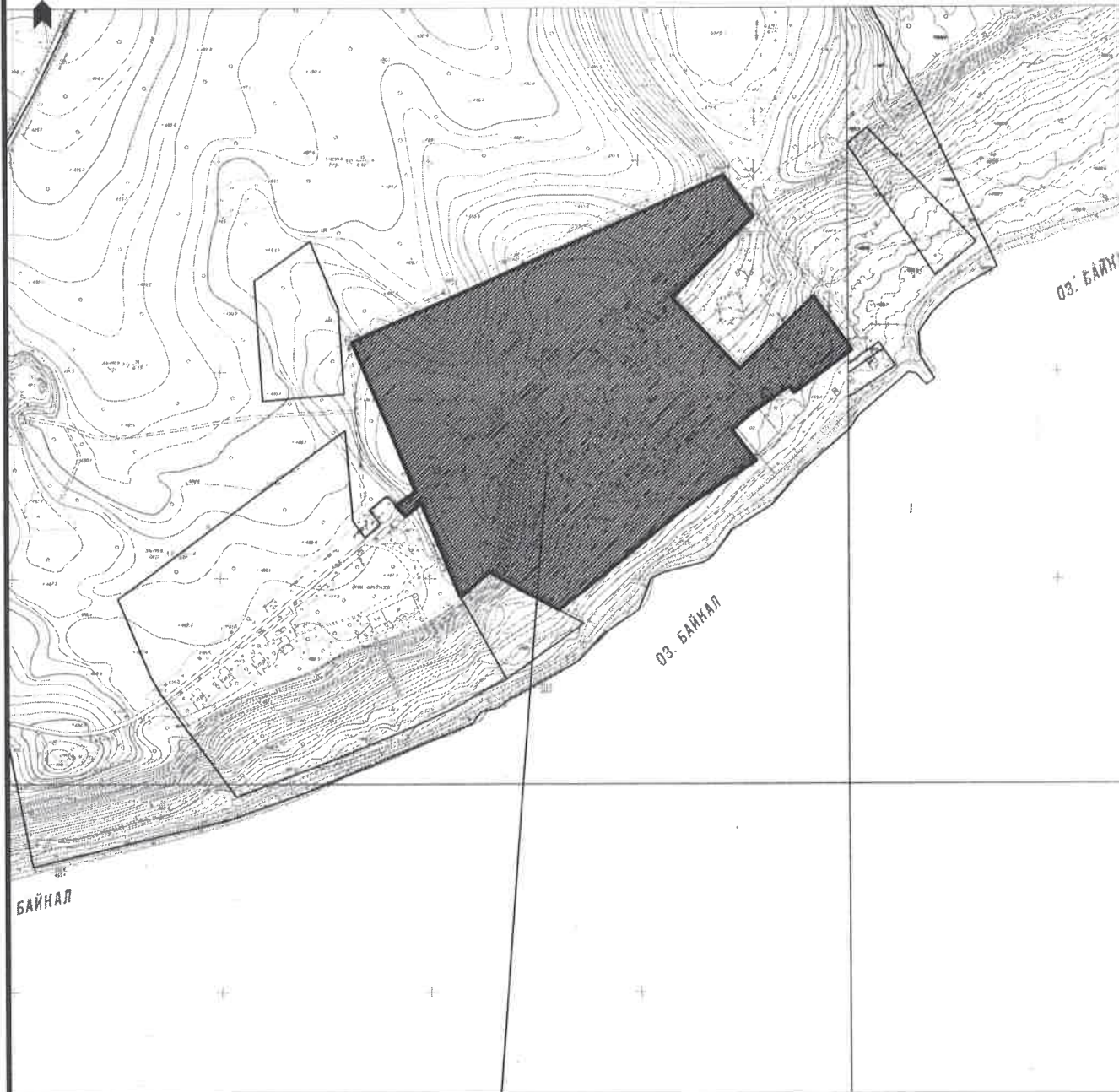
проектируемый земельный участок

Разрешенное использование: под территорию оздоровительного лагеря "Радуга" Местоположение: Республика Бурятия, г.Северобайкальск, Байкальское шоссе 4км.