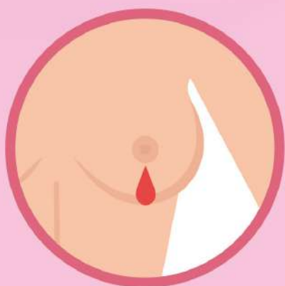
Выделения из молочной железы