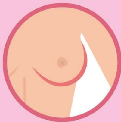
Изменение формы и втягивание соска

ВАЖНО! «Нулевая» и «первая» стадии рака выраженных симптомов не имеют