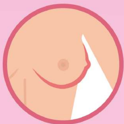
Уплотнения в груди, спаянные с окружающими тканями