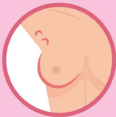
Боль как в молочной железе, так и в сосках